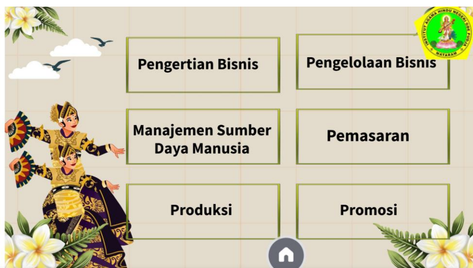
Gambar 1. Tampilan kumpulan materi dalam platform digital Genially

Tingginya respon positif pada aspek efektivitas pembelajaran mengindikasikan bahwa Genially tidak semata-mata berperan sebagai media penyampaian informasi, melainkan menjadi sarana komunikasi pembelajaran yang dapat menunjang pemahaman mahasiswa terhadap materi secara lebih bermakna serta mendalam. Fitur interaktif yang tersedia memungkinkan mahasiswa berinteraksi dengan materi secara aktif, sehingga proses pembelajaran tidak lagi bersifat satu arah. Interaktivitas tersebut berkontribusi pada penguatan semangat belajar dan keterlibatan mahasiswa dalam aktivitas pembelajaran.