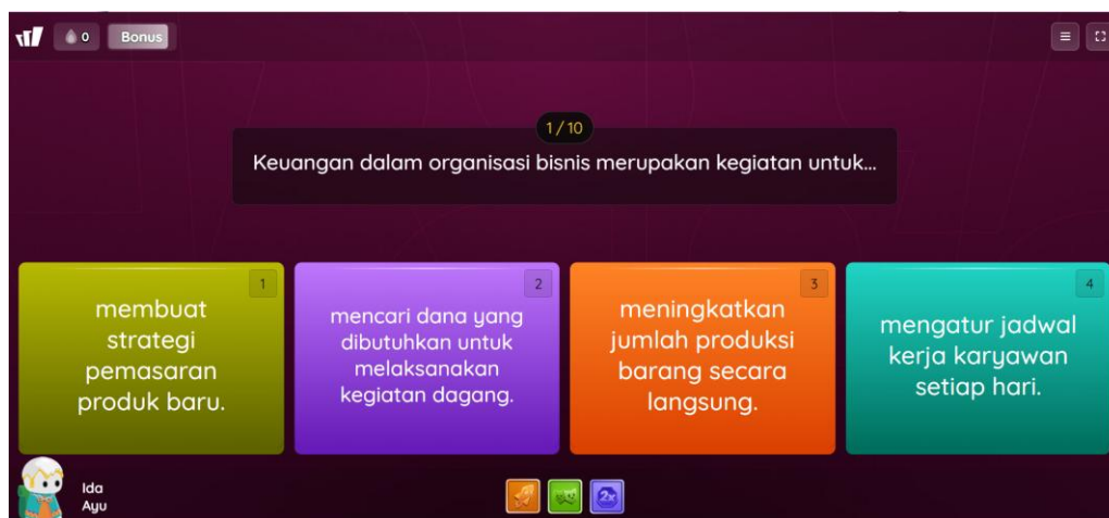
Gambar 4. Tampilan kuis menggunakan aplikasi Quizizz

Peningkatan hasil belajar yang terlihat dari perbandingan nilai pre-test dan post-test menunjukkan bahwa media pembelajaran mandiri berbasis Genially efektif dalam meningkatkan pemahaman mahasiswa terhadap materi Pengantar Bisnis. Keberhasilan ini mengindikasikan bahwa penyajian materi yang sistematis, mudah dipahami, dan interaktif dapat membantu mahasiswa menguasai konsep-konsep pembelajaran dengan lebih baik. Dengan demikian, penggunaan Genially tidak hanya berdampak pada aspek motivasi dan kemandirian belajar, tetapi juga pada peningkatan capaian akademik mahasiswa. Sejalan dengan penelitian tersebut, Fatmawati et al. , (2026) menyatakan bahwa penggunaan media pembelajaran Genially terbukti mampu meningkatkan motivasi belajar siswa secara lebih optimal dibandingkan dengan pembelajaran yang tidak memanfaatkan media tersebut. Peningkatan motivasi ini dipengaruhi oleh karakteristik Genially yang interaktif, kaya akan unsur visual, dan menarik, sehingga dapat menciptakan pengalaman belajar yang lebih menyenangkan. Selain itu, berbagai fitur yang tersedia dalam Genially menumbuhkan keterlibatan aktif siswa dalam proses pembelajaran, yang selanjutnya berimplikasi pada peningkatan kualitas pembelajaran dan capaian akademik siswa serta meningkatnya motivasi belajar mereka.