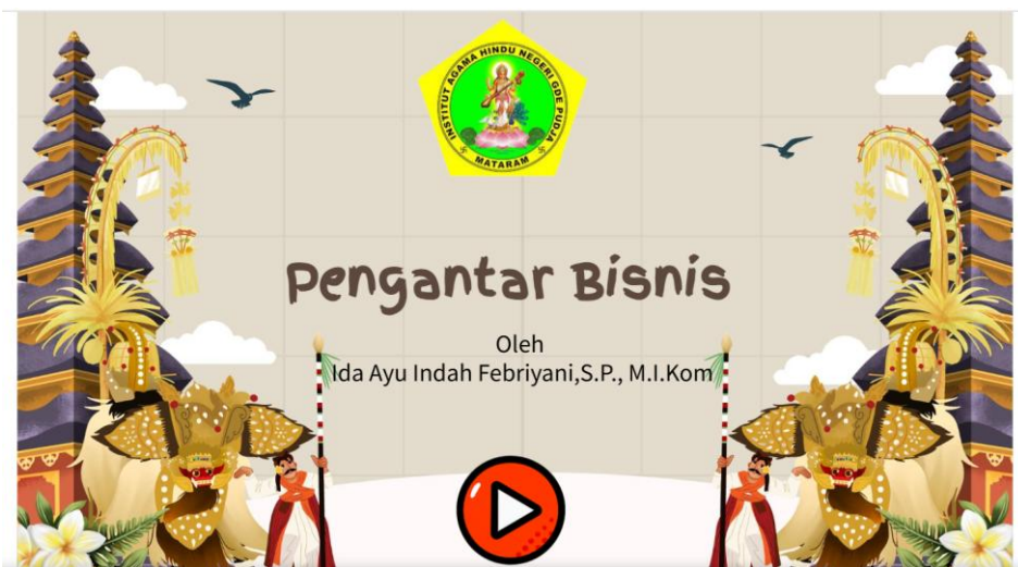
Gambar 3. Tampilan depan platform digital Genially

Aspek variasi dan daya tarik media pembelajaran memperoleh respons positif dari seluruh responden. Mahasiswa menilai bahwa tampilan media yang interaktif, didukung oleh penggunaan gambar, animasi, video, serta fitur navigasi yang menarik, mampu meningkatkan perhatian dan minat mereka dalam pelaksanaan proses pembelajaran. Temuan ini selaras terhadap penelitian yang dilaksanakan oleh Rezkillah, Mariyati, dan Muhdar (2026) mengenai pengaruh media pembelajaran interaktif berbantuan Genially terhadap minat belajar siswa sekolah dasar. Hasil penelitian tersebut menunjukkan bahwa penggunaan media pembelajaran interaktif berbasis Genially memberikan pengaruh yang signifikan terhadap peningkatan minat belajar siswa. Kondisi ini mengindikasikan bahwa pemanfaatan media pembelajaran yang variatif dan menarik dapat menciptakan suasana belajar yang lebih menyenangkan, mengurangi kejenuhan, serta menghindarkan mahasiswa dari pengalaman belajar yang monoton. Dengan demikian, desain media pembelajaran yang interaktif memiliki peran strategis dalam meningkatkan perhatian, keterlibatan, dan partisipasi aktif mahasiswa selama proses pembelajaran berlangsung.