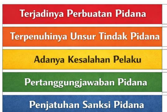
Gambar 2. Alur Metode Penelitian Hukum Normatif