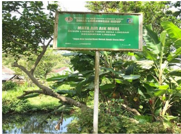
Gambar 1. Sumber Air